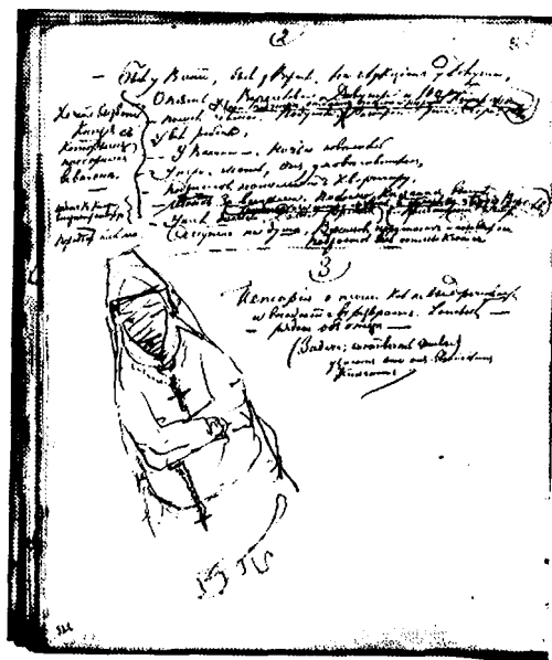
3. Ф. М. Достоевский. Подготовительные материалы к роману «Идунок». 1872—1874. Автограф